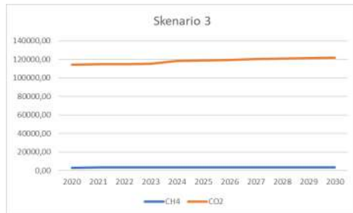
Gambar 3. Grafik Emisi Gas CH 4 dan CO 2 Total Skenario 3