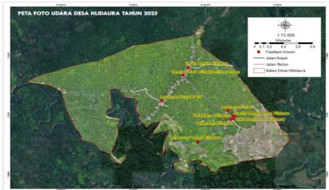
Gambar 2. Peta foto udara dan sebaran fasilitas umum di Desa Hilidaura Kecamatan Mandrehe Barat

Berdasarkan Gambar 2 yang dihasilkan dari citra drone, dapat diperoleh informasi mengenai penutupan lahan, batas administrasi desa dan fasilitas umum yang ada di Desa Hilidaura. Peta ini menjadi hal penting dalam menggambarkan kondisi geografis dan administrasi secara aktual dan akurat dalam mendukung perencanaan pembangunan dan pengambilan kebijakan dengan data spasial. Secara administrasi Desa Hilidaura merupakan salah satu desa yang ada di Kecamatan Mandrehe Barat Kabupaten Nias Barat Provinsi Sumatera Utara. Berdasarkan data BPS [5] bahwa luas wilayah desa ini adalah 2,78 km 2 yang terdiri ada 2 (dua) dusun. Desa Hilidaura memiliki ketinggian antara 20 sampai dengan 50 meter diatas permukaan laut (dpl). Wilayah ini beriklim tropis basah dengan musim hujan dan musim kemarau yang sangat mempengaruhi aktivitas budidaya pertanian.