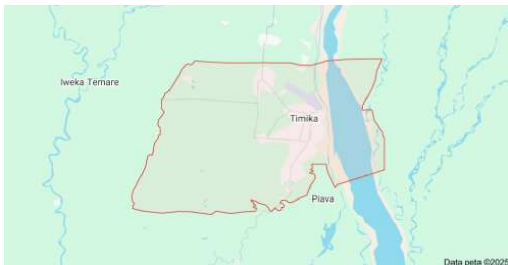
Gambar 1. Peta Lokasi Distrik Mimika Baru Sumber: Google Maps, 2025[13]

Penelitian ini menggunakan pendekatan kuantitatif dengan teknik analisis deskriptif (studi kasus), Dimana di dalam pelaksanaannya terdiri dari perhitungan perkiraan jumlah penduduk, timbulan sampah dan kebutuhan peralatan penunjang pelayanan persampahan. Studi kasus yang dimaksudkan disini adalah sistem pelayanan persampahan serta kebutuhan peralatan penunjang pelayanan persampahan di lokasi penelitian. Penelitian ini sendiri dilaksanakan di Distrik Mimika Baru, Kabupaten Mimika, Provinsi Papua Tengah, yang memiliki 11 kelurahan dan 3 kampung, dengan luas wilayah sebesar \pm 1.509,48 km 2 [6]. Lokasi penelitian ditunjukkan pada Gambar 1 berikut ini.