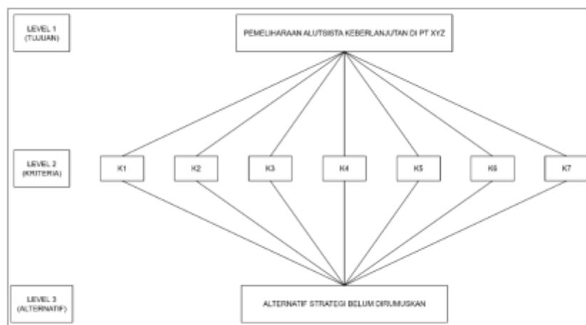
Gambar 1. Struktur Hierarki AHP untuk Pemeliharaan Alutsista Berkelanjutan di PT XYZ

Struktur hierarki ini diharapkan menjadi dasar konseptual bagi proses penilaian multikriteria dalam konteks keberlanjutan pemeliharaan alutsista. Gambar berikut menunjukkan struktur hierarki AHP yang disusun dalam penelitian ini.