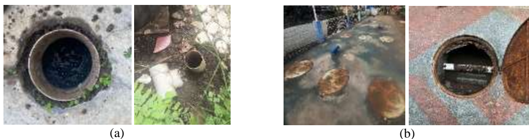
Gambar 1. Tampak unit sistem (a) Tangki septik; (b) IPAL komunal sistem ABR.

Penelitian ini dilaksanakan di wilayah Kota Bandung, Provinsi Jawa Barat, yang memiliki kompleksitas antara sistem individual dan sistem komunal. Lokasi sampel tangki septik dipilih secara purposif pada tiga kecamatan. Ketiganya merepresentasikan variasi sistem pengolahan: Buahbatu (11 unit), Coblong (11 unit), dan Kiaracondong (10 unit). Sedangkan lokasi IPAL, masing-masing tersebar di kecamatan Coblong, Mandalajati dan Sukajadi. Selain itu, kriteria seperti keterjangkauan teknis, aksesibilitas serta kesediaan responden menjadi pertimbangan dalam memilih cakupan area. Gambar 1 memperlihatkan contoh septik tank individual (a) dan IPAL skala komunal (b).