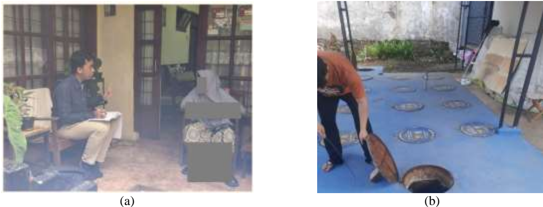
Gambar 2. Wawancara dan survei (a) Rumah tangga dengan tangki septik; (b) IPAL komunal.

Data primer diperoleh melalui survei lapangan dan wawancara terstruktur dengan pengelola dan pengguna fasilitas sistem. Setiap unit IPAL dan tangki septik yang dikunjungi didokumentasikan aspek teknisnya, seperti jenis sistem, jumlah sambungan, kondisi operasional dan volume air limbah. Wawancara dan survei di lokasi penelitian dapat dilihat pada Gambar 2 .