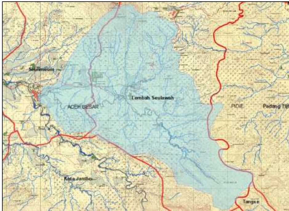
Gambar 2. DAS Sungai Krueng Seulimeum