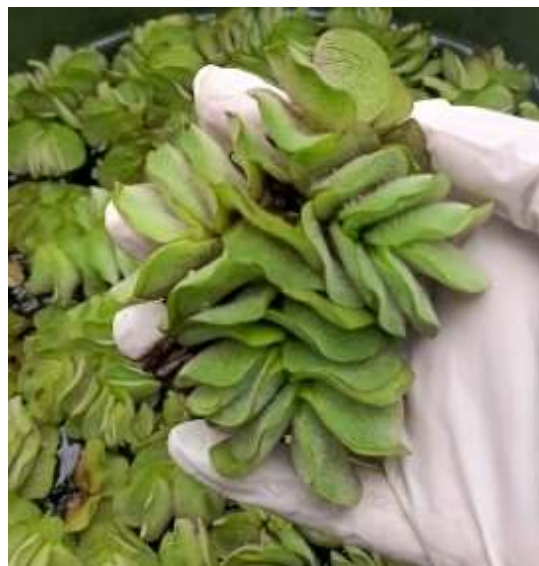
Gambar 1. Tumbuhan Kiambang ( Salvinia molesta )

Penelitian ini menggunakan box polietilena (31×23 cm) sebagai reaktor, oven pengering, timbangan digital, gelas ukur, pH meter, pinset, gunting, dan loyang oven. Analisis logam berat menggunakan alat Atomic Absorption Spectrophotometry (AAS). Bahan utama adalah tumbuhan air Salvinia molesta (Kiambang) berumur ±1 bulan. Media tanam berupa limbah cair elektroplating yang mengandung logam berat Nikel didalamnya.